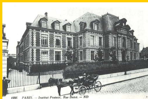
E : Rue du Docteur Roux ensuite

On ne saura jamais, parmi toutes les raisons de désespoir qui assaillent alors les Français, laquelle l'a poussé à préférer quitter ce monde.