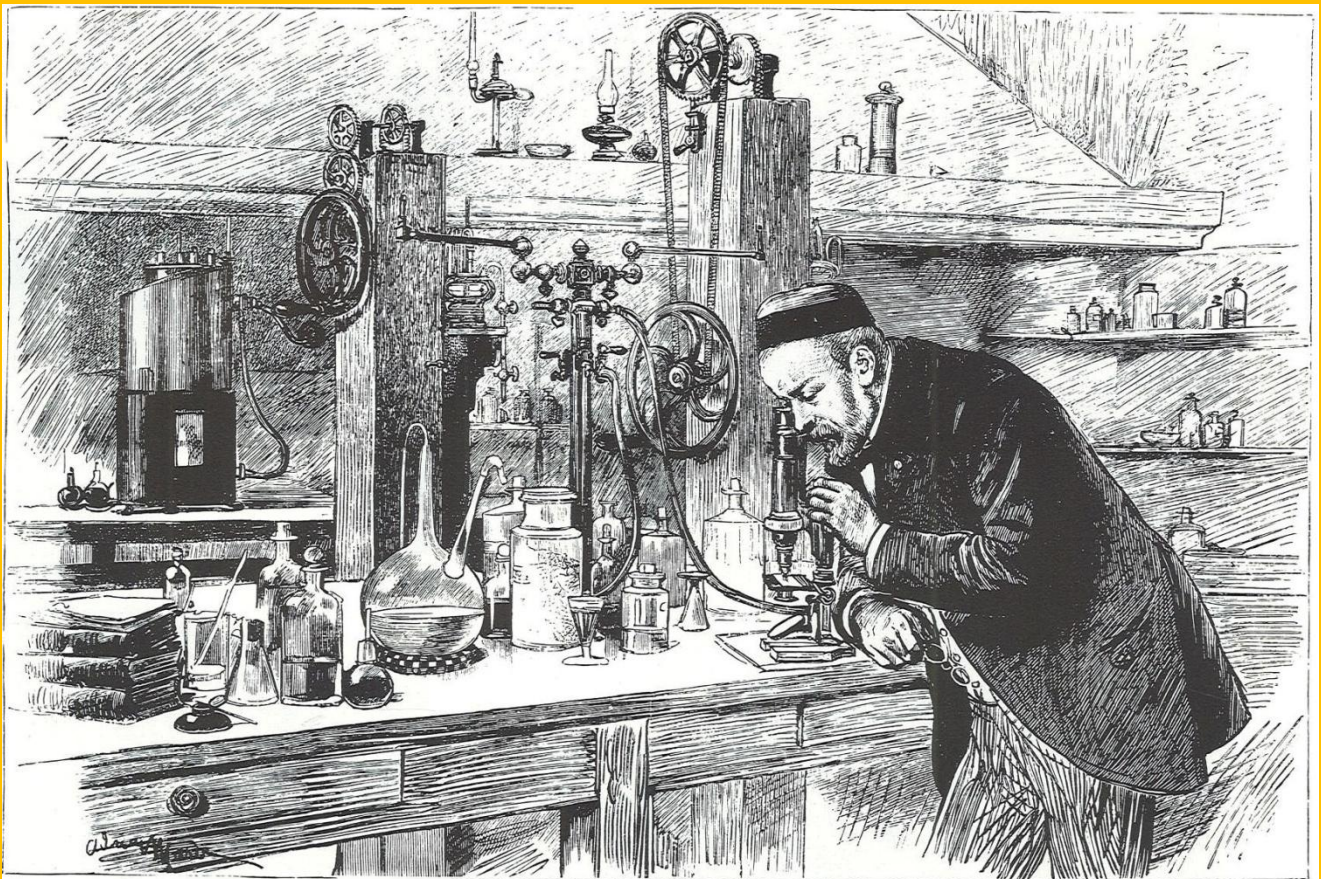
B : Pasteur dans son laboratoire – Gravure d'Adrien MARC (1885)