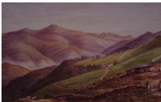
(3) Paysage de la vallée de Munster vers 1850

Mais des changements politiques surviennent dans l'organisation du duché lorrain. En 1566, l'abbaye des dames chanoinesses de Remiremont cesse d'être sujette immédiate du Saint-Siège : elle perd son indépendance et passe sous la suzeraineté du duc de Lorraine. Celui-ci reprend ses droits de mise en gage des gazons qu'il concède à trois villages vosgiens : La Bresse, Gérardmer et Le Valtin.