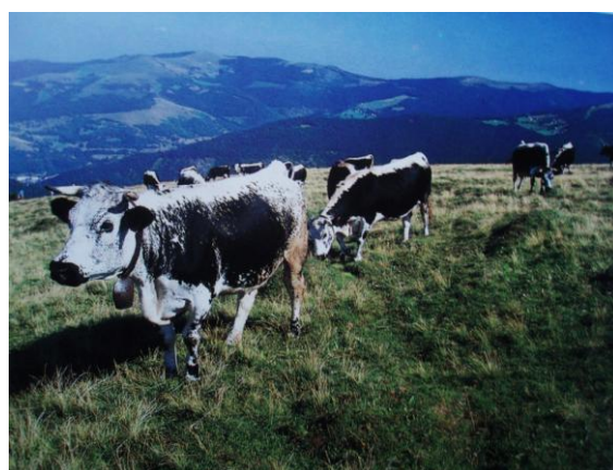
(4) Vaches de race vosgienne en altitude

Ces fermes de montagne ont toujours été hospitalières et ont volontiers restauré et hébergé les visiteurs de passage. Devenues aujourd'hui des fermes-auberges, elles tentent de concilier - et l'été plus difficilement - une activité séculaire, l'élevage et la production du munster, et une activité complémentaire d'accueil liée au tourisme. Quelques-unes restent ouvertes l'hiver, pour le ski de fond, les relais équestres, l'artisanat de montagne, diversifiant ainsi les ressources de l'économie pastorale des Hautes-Vosges.