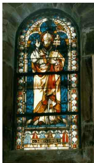
Chapelle Saint Léon au Dabo