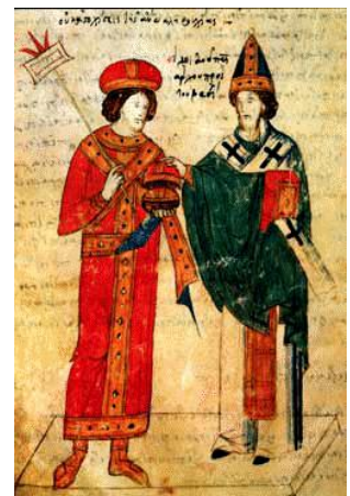
Michel, patriarche de Constantinople et Léon IX (manuscrit grec du XV e S.) BN - Palerme