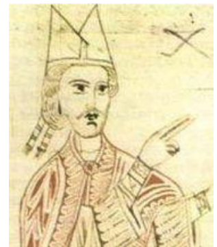
Hildebrand, futur pape Grégoire VII