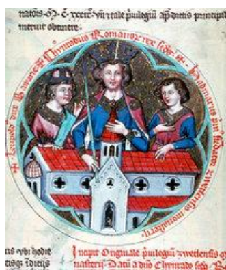
L'Empereur Konrad II (au centre)

En reconnaissance, l'évêché de Toul où il avait été apprécié lui est dévolu. L'empereur aurait préféré lui offrir un siège plus lucratif mais il pense que ses qualités seront utiles là-bas à l'ouest, près de la frontière avec le royaume de France ! Brunon fait son entrée à Toul en mai 1026 ; trop jeune pour être ordonné, il y est intronisé par son cousin l'évêque de Metz. Après maints préalables diplomatiques entre l'empereur et l'archevêque de Trèves, la cérémonie d'ordination a lieu un an plus tard dans la ville impériale de Worms.