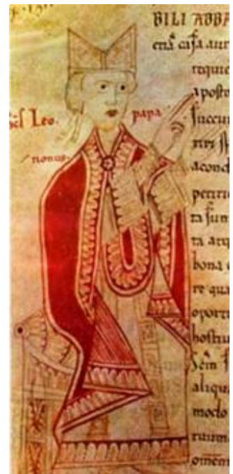
Léon IX, parrain du chant grégorien