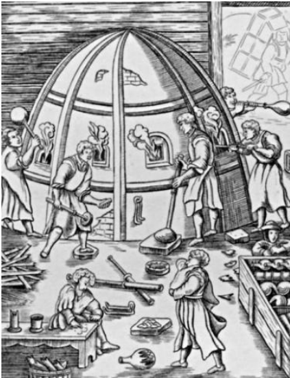
Verrerie au 16 e siècle

Dans le courant du 15 e siècle, par la volonté des ducs de Lorraine, cet artisanat se répand à partir des monastères et des grands chantiers des cathédrales de Toul, de Metz et de Verdun, notamment pour les vitraux.